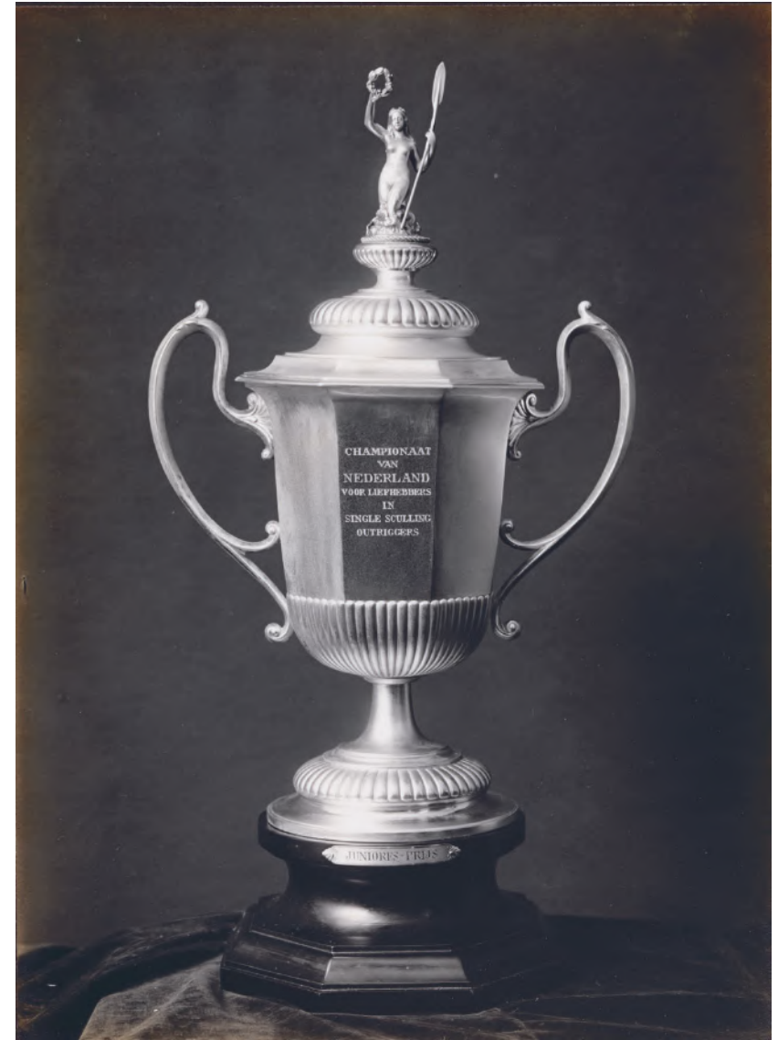
De Juniores Beker ( The Juniores Trophy ), 1911

Na de Tweede Wereldoorlog dwong wereldroeibond FISA de wedstrijden op de internationale roeikalender samen te voegen. Vanaf 1953 werden de wedstrijden van de KNZ&RV gecombineerd met de Holland Beker. Het toernooi kreeg toen de naam Koninklijke - Holland Beker. De organisatie heeft met enige regelmaat geëxperimenteerd met andere locaties dan de Bosbaan. In de Willem-Alexander Baan in Rotterdam heeft Nederland een tweede toplocatie. Na een geslaagde proef in 2015 vindt de wedstrijd in 2019 daar plaats met de bijzondere status van World Cup III toernooi.