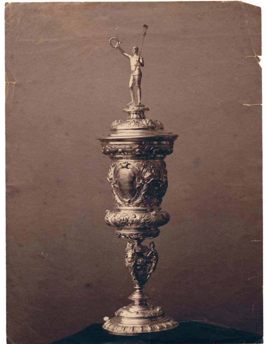
Holland Beker, ~1900

De kampioen van Nederland kreeg de prijzen die tot op de dag van vandaag worden uitgereikt aan de winnaar van de Holland Beker. Als permanent aandenken de gouden medaille met daarop het kleine Rijkswapen van Nederland. Daarnaast als wisselprijs een sjerp in de nationale driekleur met zilveren gesp en een kostbare zilveren beker, dé Holland Beker. Die wordt bewaard in een ebbenhouten kist met daarop zilveren plaatjes waarin ieder jaar de naam van de winnaar wordt gegraveerd.